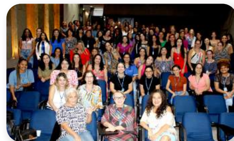
Adolescentes trabalhadoras, aprendizas e colaboradoras da Assprom se reúnem para assistir à palestra