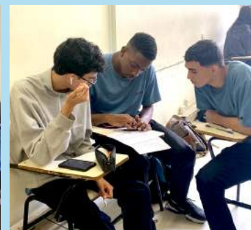
Jovens participam de atividades na Assprom e em órgãos públicos parceiros