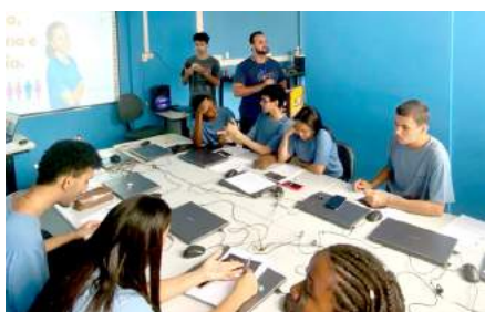
Assprom oferece cursos para os adolescentes e jovens durante o Recesso Forense