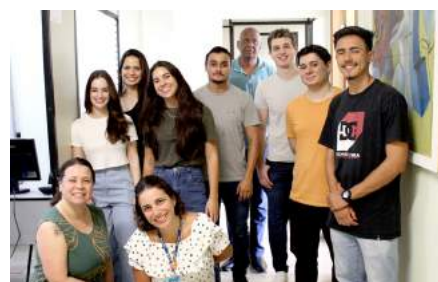
Alunos da Faculdade de Ciências Médicas promovem atividades de saúde para adolescentes e jovens