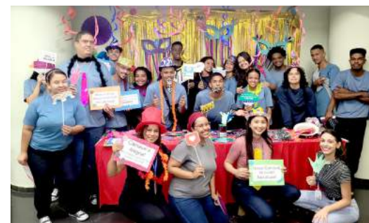
Jovens posam para foto após palestras

Através dessas atividades, esperamos conscientizar e educar os jovens sobre questões importantes relacionadas à saúde e segurança, contribuindo para uma folia mais responsável e saudável para todos.