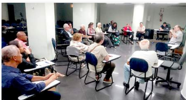
Associados se reúnem na sede da Assprom

Na ocasião, os associados abordaram temas fundamentais para a organização, incluindo a análise do Relatório de Atividades da Diretoria referente ao exercício de 2023, a Prestação de Contas e o Balanço Geral de 2023, acompanhado das