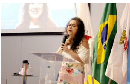
Dia da Mulher: colaboradoras e adolescentes da Assprom participam de palestra motivacional na Una