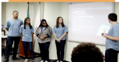
Ao término do programa, os aprendizes organizam uma feira para apresentar o que aprenderam